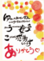
手描き部門準グランプリ