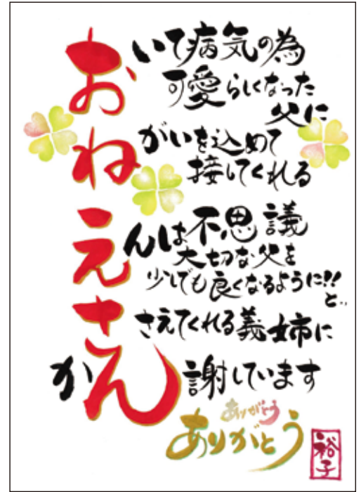
図1 第1回グランプリ作品

入賞作品に関しては2018年11/22(木)～11/25(日)に東京スカイツリータウン・ソラマチ9階の郵政博物館で開催される折り句コンテスト展示会にて展示させていただきます。 表彰式は11/23(祝) 13:00～を予定しています。