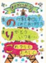
手描き部門準グランプリ