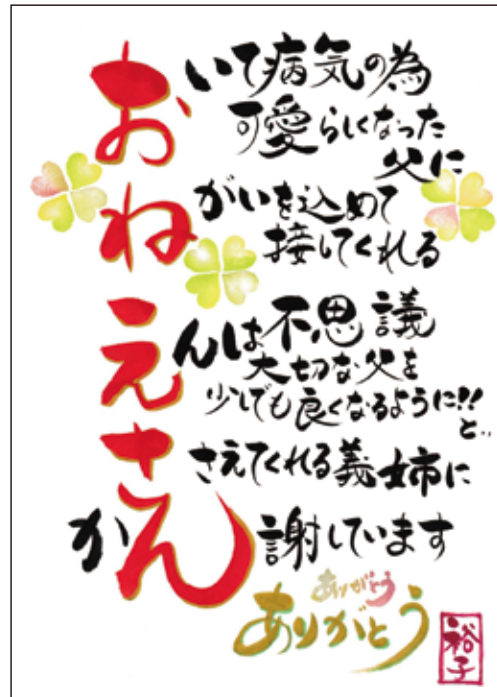
図1 第1回グランプリ作品