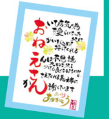
（例）第一回グランプリ作品

まくらが、いのりになっている折り句 ＜例＞まくら…「いのり」「折り」でお描きください